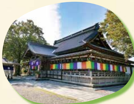
⑦ 倶利伽羅不動寺 小矢部市と石川県津幡町との 境に位置する日本三不動尊の一つ。