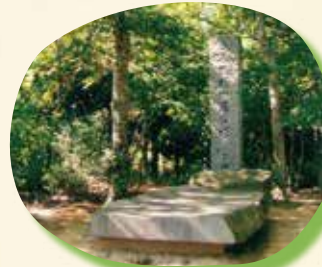
④ 猿ヶ馬場 倶利伽羅合戦において、 平家の総大将「平維盛」が 本陣を置いたところ。