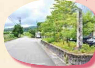
① 倶利伽羅源平の郷 埴生口横