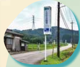
① 源平ライン 入口

全長4.5kmのドライブコース。 万葉の時代より多くの歌人たちが詠んだ 歌碑や史跡に出会い、移り変わる 四季の自然とふれあうことができます。