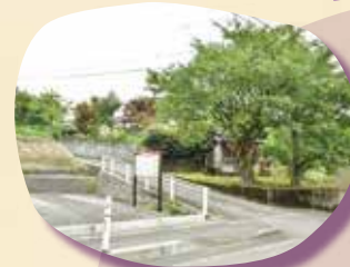
① 倶利伽羅古道 小矢部口