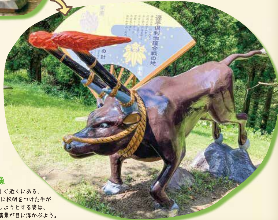
⑤ 火牛の像 猿ヶ馬場のすぐ近くにある、 火牛の像。角に松明つけた牛が 今にも突進しようとする姿は、 源平合戦の情景が目に浮かぶよう。