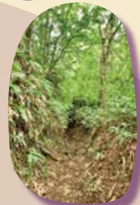
③ 倶利伽羅 古道 途中