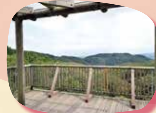
⑥ 倶利伽羅 県定公園展望台