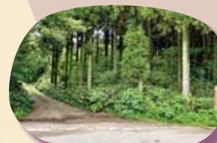
⑤ 倶利伽羅古道 (津幡口)