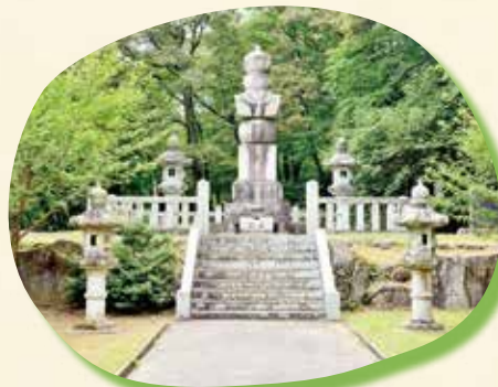
⑥ 源平供養塔 高さ6.8mの五輪塔。 合戦において犠牲となった 源平両軍の兵士を弔うため建立された。