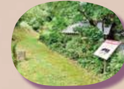
② 倶利伽羅 道祖神