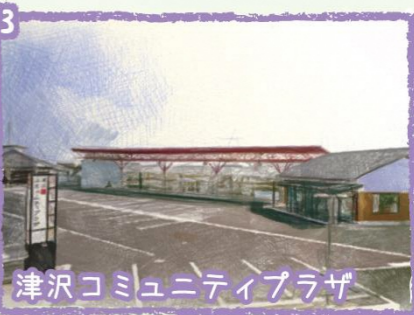
13 津沢コミュニティプラザ 多目的ホール、会議室、和室、調理実習室など、様々な会議・活動に対応可能な施設です。図書コーナー、学習室もあります。