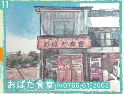
11 おばた食堂 TEL0766-61-2062 味とまごころの店。津沢のソウルフード「まんぶく定食」などボリュームある定食をはじめ、丼・麺類・おつまみなども充実しています。