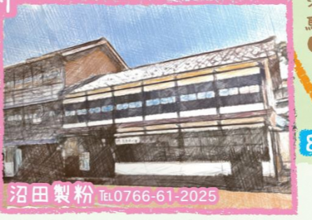
7 沼田製粉 TEL0766-61-2025 天保元年創業。長い歴史と伝統技術を積み重ね、昔ながらの自然素材にこだわり、手延べ麺の味わいを残しつつ、美味しさを追求し続ける鶴亀手延べ乾麺を作る会社です。