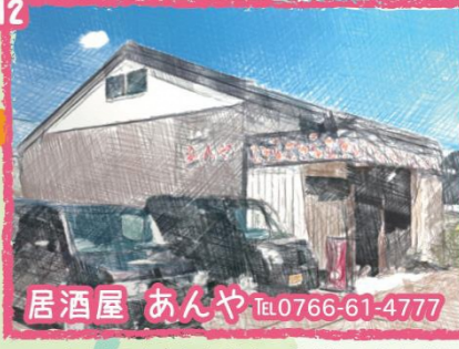
12 居酒屋 あんや TEL0766-61-4777 一年中、津沢夜高あんどんの吊り物を見ながら飲食を楽しめるお店。原寸大の吊り物の迫力と色彩は本当にすごい! 家族やお友達、仲間と集まるには最適です。