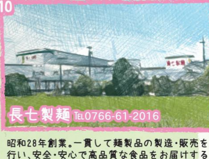
10 長七製麺 TEL0766-61-2016 昭和28年創業。一貫して麺製品の製造・販売を行い、安全・安心で高品質な食品をお届けするとともに新しい食文化を提案しています。